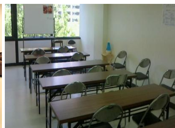
20 名収容可能な会場