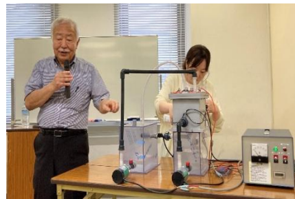
装置を持ち込み実演