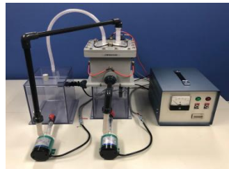
私の UH-1 生成装置“しずか号”