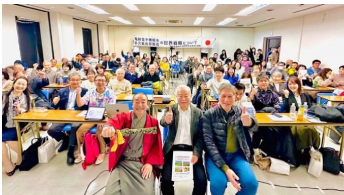
2025 年 1 月 25 日(土)の第一回総会風景

私たち(一社)地球環境改革再生機構はこのような販売チームを支援していく所存です。