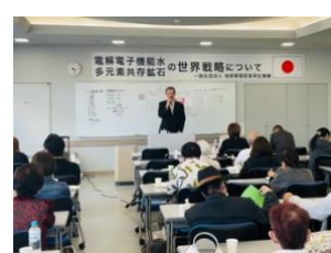
会場には 約 50 名が集まりました