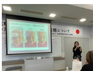
北海道、三重などの 体験について