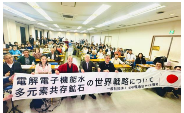
2025 年 3 月 21 日(金)の第二回総会風景

※ 第三回総会は 5 月 24 日(土) 13:00~16:30 前回と同じ会場(池袋)で行います。