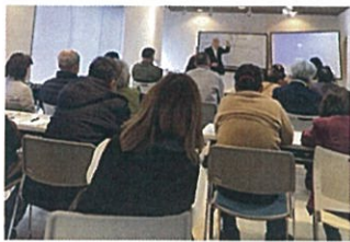
●限定30名の会場 当日は満席でした