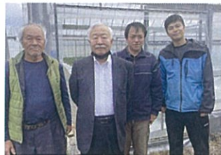
●いちご農家の 森田農園にて