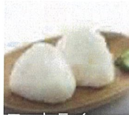
●会場で配られたEcomizerで炊いた おにぎり(大好評でした)