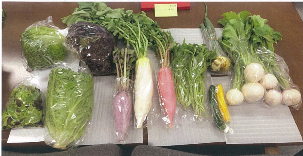
埼玉小野農園で収穫した野菜

皆さん本日は、埼玉、広島で収穫した野菜です。皆瑞々しく元気です。昔の野菜の栄養と味が復活しました。収穫量は例年の20%以上増加しました。