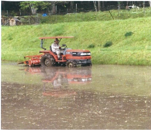
広島：安芸高田の田植え（松本氏）