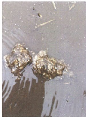
右側：田植え前の水田のあちこちにはカエルの卵が散見された。