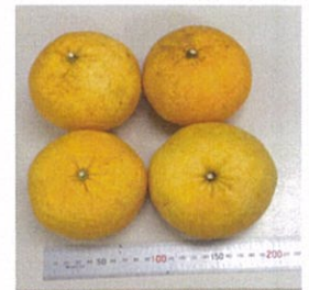
ECOMIZER 灌注の夏ミカン (広島: 梶原さん)

左上: ・フリルレタス ・レッドリーフレタス ・ルッコラ・新玉ねぎ 大根左から ・京むらさき大根 (紫) ・若桜大根 (白) ・茜わらべ大根 (ピンク) 左下: ・ベビーリーフ・リーフレタス・ズッキーニ (緑、黄)・サラダカブ・アヤマカブ 農薬は全く使っていません。