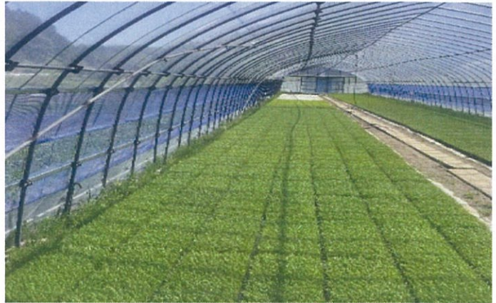
島根県大東町のビニールハウスの稲 （山下氏）