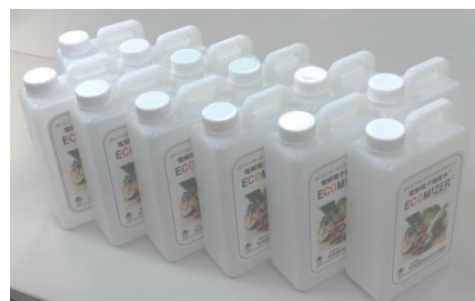
小分け用1リットルタンク