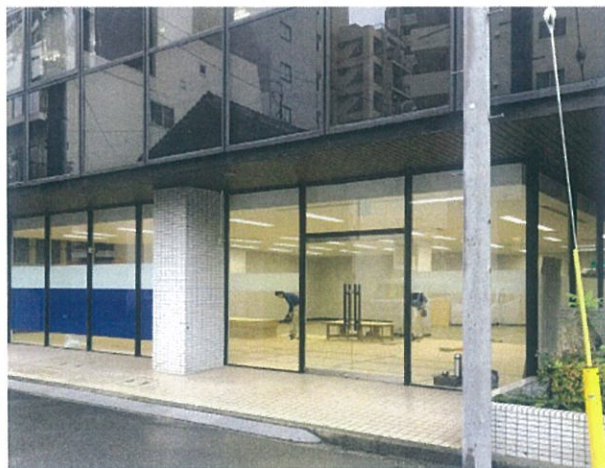
1階:プレゼンテーションルーム