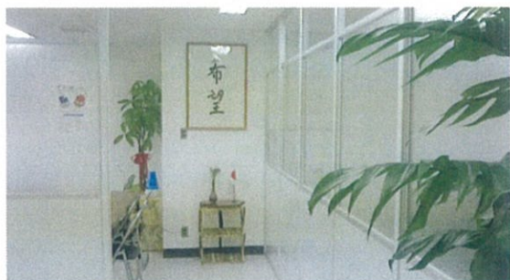
広島は日本の「希望の地」という意味で、4階入口正面に「希望」の文字が掲げられている。