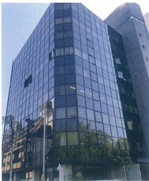
三栄広島ビル 1階・4階