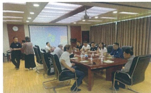
西安実験・実践センターでの勉強会

西安電子機能水展示基地は、全体で百haの面積があり、リンゴ、ぶどう、さくらんぼ、アメリカカンチエリー、あんず等の苗木を中心とした生産農場で、年間百万本以上を生産しています。種から成木にいたるまで、全て電子機能水を用いて生産しています。