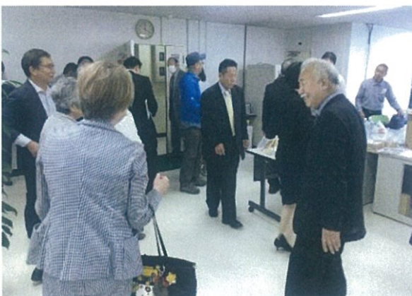
新事務所での初の聴講に集まった方々 (熱のこもった講習会でした)