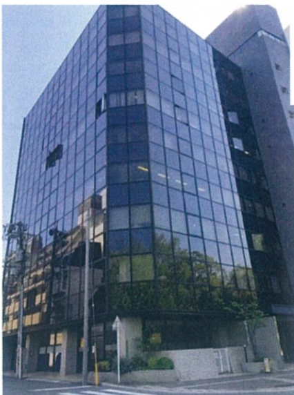
広島事務所全景(原爆ドームから南へ 800m)