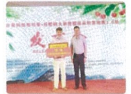
品評会で金賞を受賞

現時点でも多くの農業法人から引き合いが入っており、日本も中国や東南アジア、メキシコなどに負けないような実績を作れるようになりました。