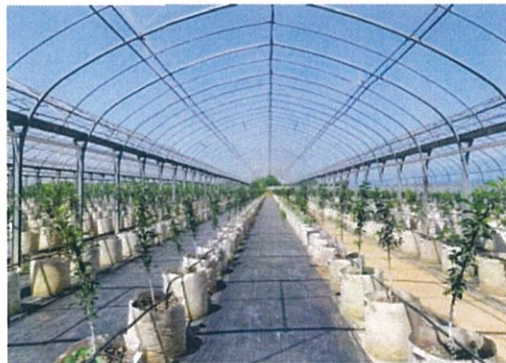
全長 200m のあんずとサクランボハウス