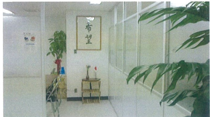
広島は日本の「希望の地」という意味で、入口正面に「希望」の文字を掲げている。