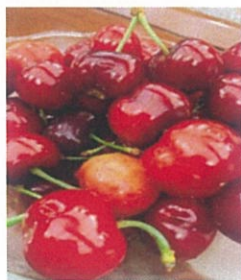
金賞を受賞したさくらんぼ

西安電子機能水展示基地は、全体で百haの面積があり、リンゴ、ぶどう、さくらんぼ、アメリカカンチエリー、あんず等の苗木を中心とした生産農場で、年間百万本以上を生産しています。種から成木にいたるまで、全て電子機能水を用いて生産しています。