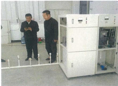
副市長が視察に来社