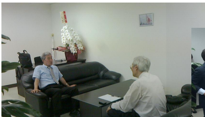
ユッタリとした応接室 （ここで全ての商談が行われます）