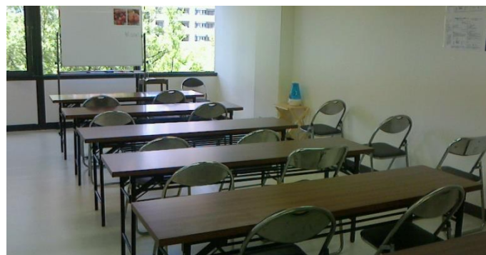
研修室（20名入ってもユッタリです）