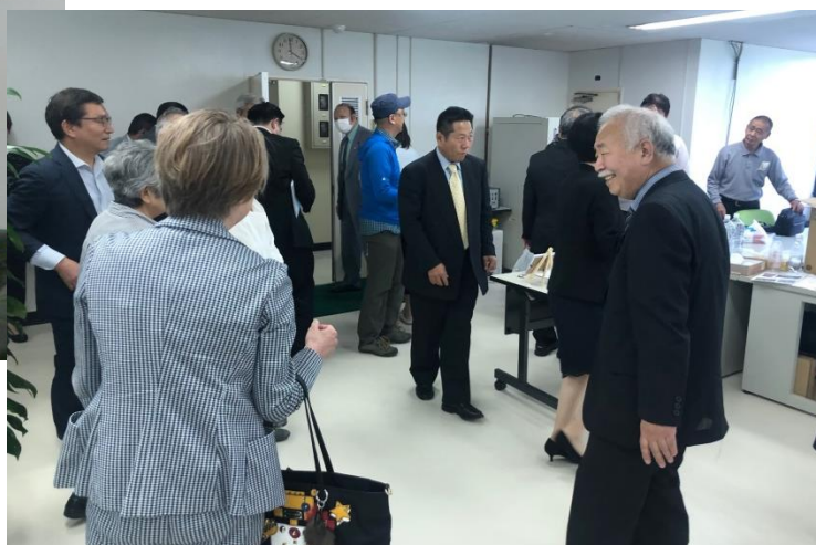
聴講に集まった方々（熱のこもった講習会でした）