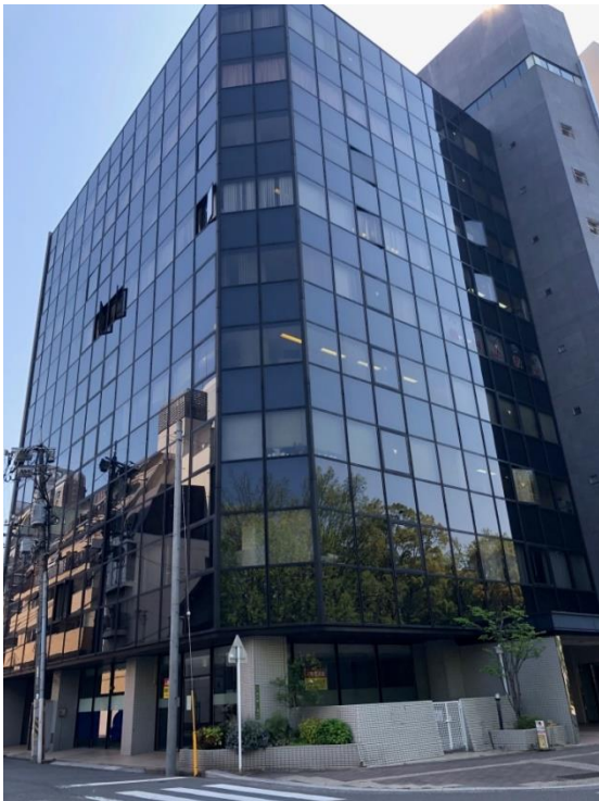
全景(原爆ドームから南へ800m、極めて環境の良い場所です)

今後、世界の中心として数多くの情報がHiroshima Officeから発信されます。今後ともよろしくお願い致します。