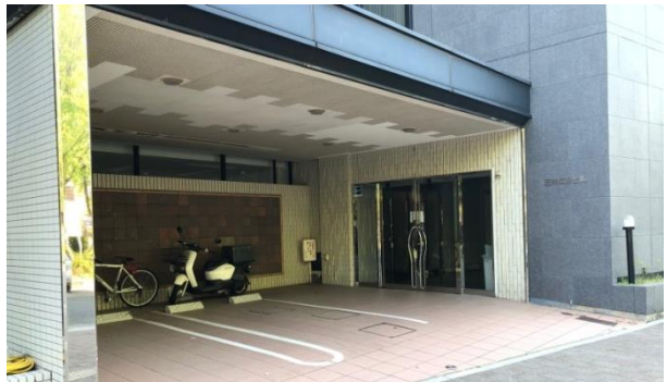
ファサード(広島では品の高いビルです)