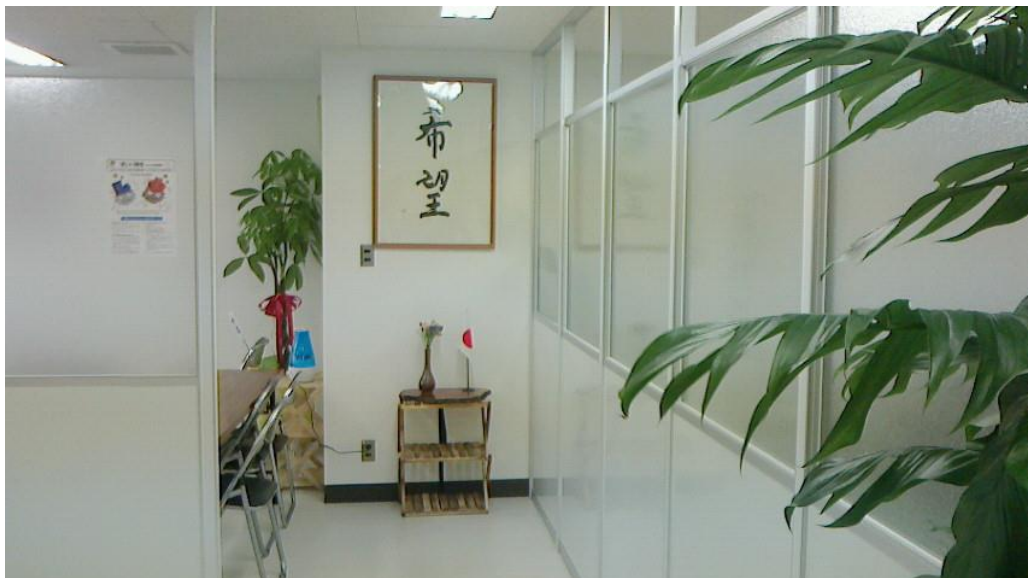
入口正面に「希望」の文字、広島は日本の「希望の地」という意味です